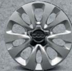
16" ocelová kola s lesklými kryty