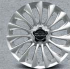
18" lesklá kola z lehkých slitin