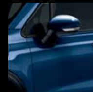
888 MODRÁ VENEZIA