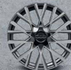
18" leštěná kola z lehkých slitin (opt 5A6)