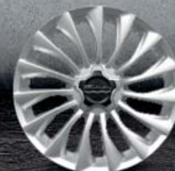
18" lesklá kola z lehkých slitin (opt 439)