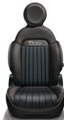
Šedá textilie/ hnědá eko kůže

Doplňky na středovém tunelu a obložení dveří s efektem leštěného hliníku