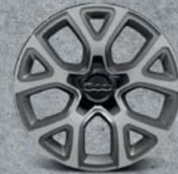
17" kola z lehkých slitin s diamantovou úpravou