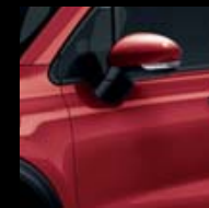
895 ČERVENÁ PASSIONE