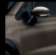
400 BRONZOVÁ MAGNETIC