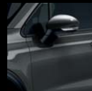
679 ŠEDÁ MODA