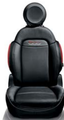
Perforovaná černá kůže s červenými vložkami

Doplňky na středovém tunelu a obložení dveří s efektem leštěného hliníku