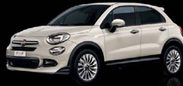
CITY LOOK Elegance chromovaných detailů v kombinaci s nezaměnitelným stylem crossoveru a pohonem 4x2