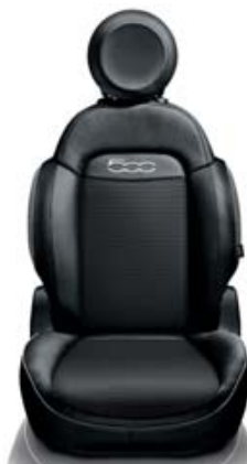
Texturovaná šedá textilie/ černá eko kůže

Doplňky na středovém tunelu a obložení dveří s efektem leštěného hliníku