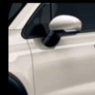
331 ŠEDÁ ARTE