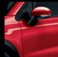
831 ČERVENÁ AMORE