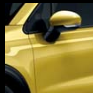
824 ŽLUTÁ AMALFI