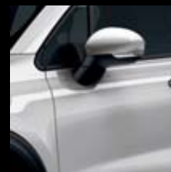
348 ŠEDÁ ARGENTO