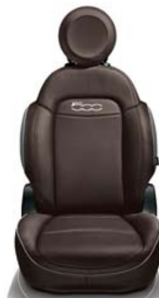
Perforovaná hnědá kůže s šedými vložkami

Doplňky na středovém tunelu a obložení dveří s efektem leštěného hliníku