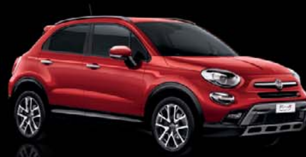
OFF-ROAD LOOK Dynamický styl a dobrodružná povaha díky pohonu 4x4 nebo 4x2 s funkcí Traction+