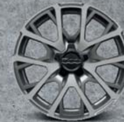
18" kola z lehkých slitin s diamantovou úpravou