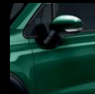
330 ZELENÁ TOSCANA