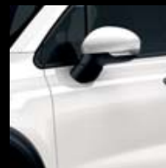
296 BÍLÁ GELATO