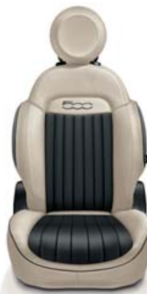
Šedá textilie/ běžová eko kůže

Doplňky na středovém tunelu a obložení dveří s efektem leštěného hliníku