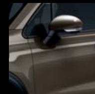
399 BRONZOVÁ MAGNETIC