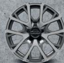
18" kola z lehkých slitin s diamantovou úpravou (opt 4AY)