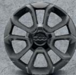
16" leštěná kola z lehkých slitin (opt 421)