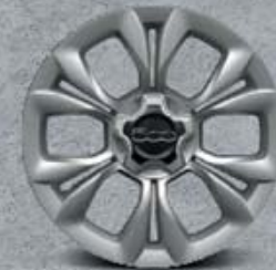
17" kola z lehkých slitin se saténovou úpravou