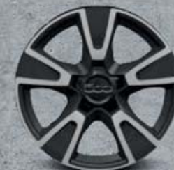
17" kola z lehkých slitin s diamantovou úpravou (opt 68P)