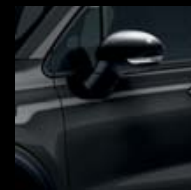
601 ČERNÁ CINEMA